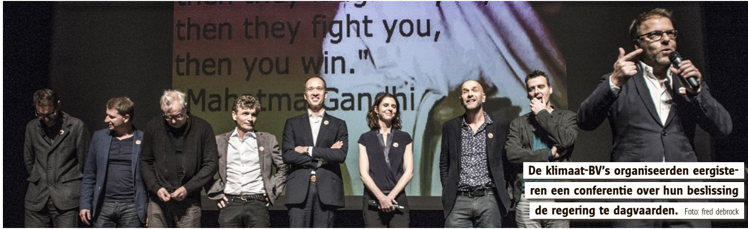
De klimaat-BV's organiseerden eergisteren een conferentie over hun beslissing de regering te dagvaarden.